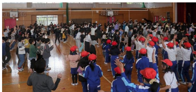
みんなで踊ろう！ジンギスカン

そして、ひととき体育館は、脈々と伝わるダンス「ジンギスカン」を全校で踊るダンスフロアとなったのです。