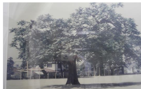
校庭にあった校木くるみの木