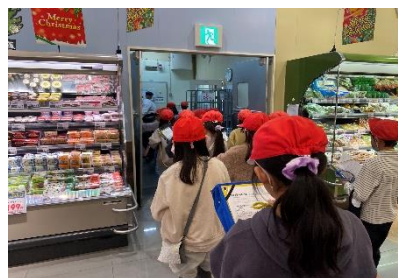
3年生 ウジェスーパー見学 社会科「店ではたらく人」に関連し、店舗見学と店員の方にお話を伺いました。