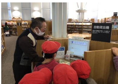
2年生 リフノスの図書館見学 学級ごと訪問し、町立図書館の工夫を詳しく教えていただきました。