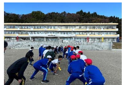
6年生 日立女子陸上競技部 ふれあい陸上教室 クイーンズ駅伝翌日に指導いただきました。試合で使用したたすきも記念にいただきました。