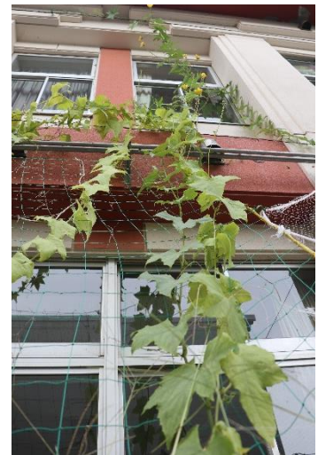
ヘチマが特別教室棟2階のひさしまで伸びています。驚きの高さです。

2学期も子どもたちの夢や志を全職員で支えていきたいと思います。今学期もどうぞよろしくお願ひいたします。