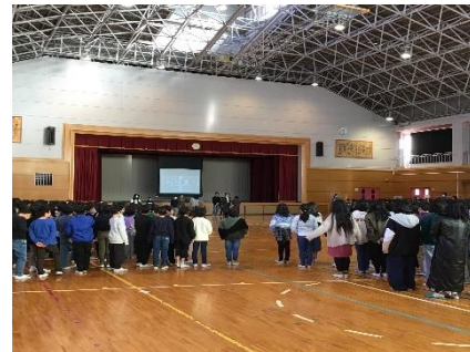
音楽委員会による音楽集会 体をほぐしてから「カントリー・ロード」を歌いました。