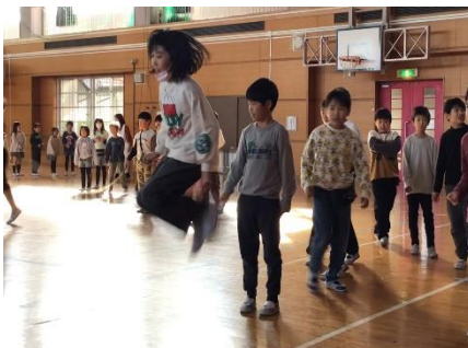
体育委員会によるなわとび大会 部門別で数日にわたり、記録を競い合いました。