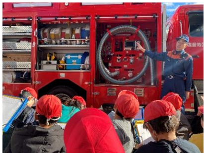
3学年利府消防署見学 消防服も着用させていただきました。