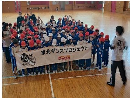
日本ストリートダンススタジオ協会主催ダンス教室 1、2、4学年で実施