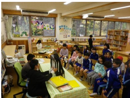
図書委員会による図書祭り 委員による紙芝居に低学年の子たちが夢中でした。

明日からの冬休みも、人とのふれあいからどの子も楽しく温かい気持ちで過ごしてほしいと願っています。冬至を境に暦は春に向かいます。寒さはこれからですが、どうぞお健やかに新しい年をお迎えください。