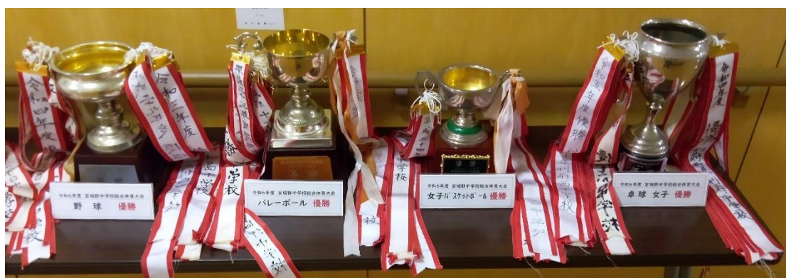
中総体優勝カップ

若葉杯卓球大会女子ダブルス 第1位 3年 さん 3年 さん 若葉杯卓球大会女子シングルス 第5位 3年 さん スマイルカップ卓球大会女子個人 第2位 3年 さん