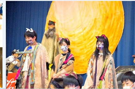
6年 劇「CATs2021～利府三小 ver～」