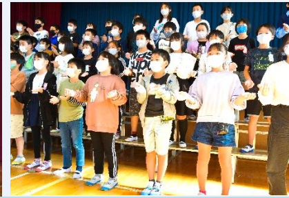
5年 リズム・歌・合奏「心をついに」