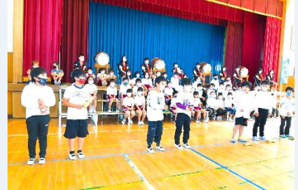
3年 リズム・歌・合奏「リズム」