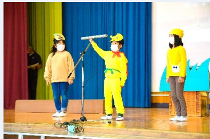
2年 劇「ハッピーたびメニュー2021」