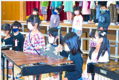
1年 リズム・歌・合奏「音楽でげんき」

学習発表会で学んだことを今後の学校生活に生かし、子供たちが様々な場面で活躍できるよう指導を継続していきます。