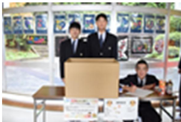
↑朝のリフードライブ回収の様子

当日の朝は、生徒会執行部を中心にした「リフードライブ」が行われました。今年度利府町のブラザーシップで決まった「フードロスを減らそう」のテーマの下、取り組んだものです。当日は、自宅から食品を持ち寄る生徒がおり、目的を達成することができました。協力いただいたご家庭に感謝申し上げます。