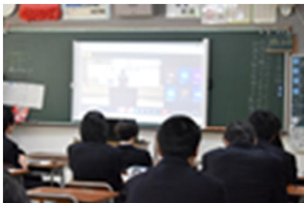
↑スクリーンを通して発表を聞く様子

昨年度とは異なる形式での発表となりましたが、夢や希望が堂々と語られました。それを聞いていた皆さん一人一人にも夢や希望があるはずです。今回の行事をきっかけにして、自分の夢について、考えてみるのも良いかもしれません。2年生は現在キャリアシップに取り組んでいます。3年生も進路選択の時期が着々と近づいています。そのときに向けて、必要な力や考え方をしっかりと身に付けてほしいと思います。