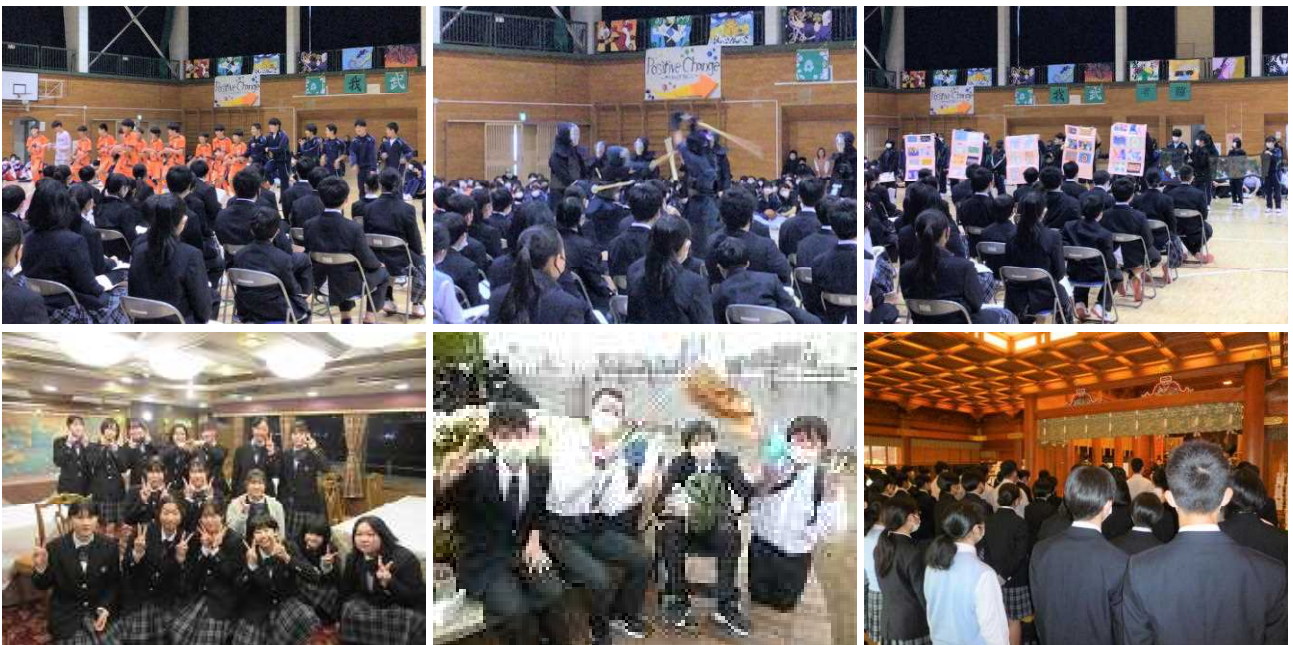
上段：対面式（サッカー部・剣道部・美術部）

新年度がスタートして1ヶ月あまり。さまざまな行事も経験しながら成長しています。5月は体育祭が控えています。すでに準備は始まっています。5月20日(土)体育祭にご期待ください。