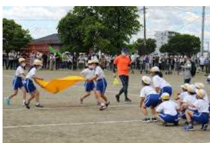
思ったより, 難しいなあ…