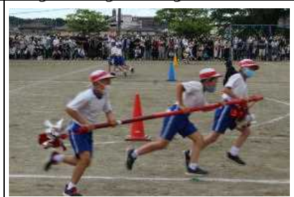
3人で力を合わせて…