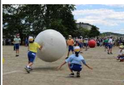
こんなに重いとは…