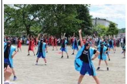
下級生のあこがれ, ソーラン!