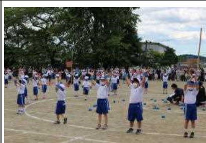
かっこよく決まった!