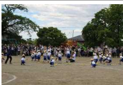
たくさん入れるぞ!