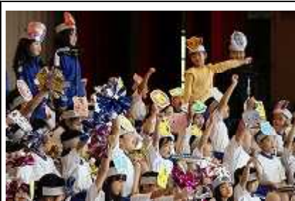
1年生(ライオンキング) 学習発表会