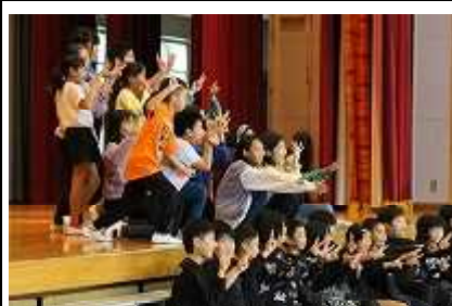
4年生(Go for it) 学習発表会