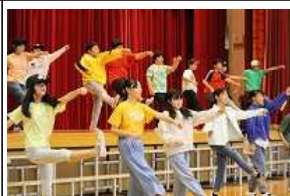
6年生(For the future) 学習発表会