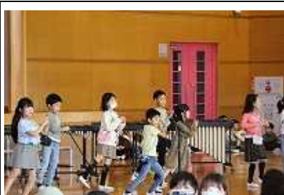
2年生(町たんけんヘレッツゴー) 学習発表会