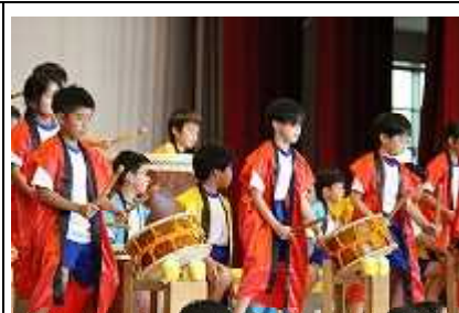
3年生(洋と和の音楽会) 学習発表会