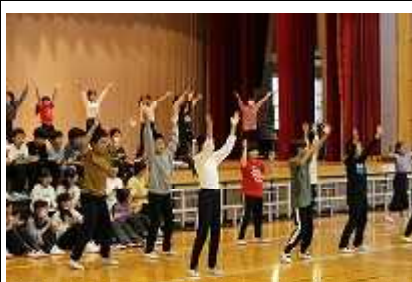
5年生(利府小ニュース5) 学習発表会