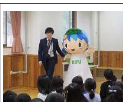
年賀状のお礼にリーフちゃんに来てくれました。