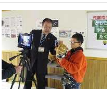
大谷選手からのグローブが利府小学校にも届きました。