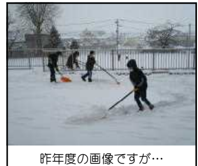
昨年度の画像ですが…