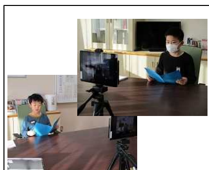
3学期始業式をリモートで行いました。